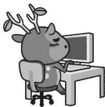
▲商工会議所検定試験隠れキャラ 「シカクン」